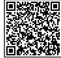
All Learning Content Related to this Topic

Solutions: Ich finde es nicht fair, wie Unternehmen die Länder im globalen Süden ausnutzen. / Wie nutzen sie sie aus? / Sie produzieren unter schlechten Arbeitsbedingungen und zahlen nicht viel. / Welche Art von Arbeit? Kannst du ein Beispiel geben? / Zum Beispiel die Bekleidungsindustrie in Asien. / Aber sie bieten den Menschen dort eine Arbeit und Einkommen. / Das stimmt, aber wenn sie einen anständigen Lohn zahlen würden, könnten die Menschen tatsächlich ihr Leben verbessern. / Aber dann würde unsere Kleidung hier mehr kosten. Ich möchte nicht mehr bezahlen. / Und deshalb finde ich es unfair. Weil du Geld sparen willst, leiden andere Menschen. / Du hast recht, so habe ich das noch nie gesehen. Aber ich habe auch nicht so viel Geld. / Ich weiß, dass du nicht viel hast. Aber wir müssen verantwortungsvollere Unternehmen unterstützen. / Du hast recht. Wenn niemand diese Shirts kauft, müssen sie etwas ändern.